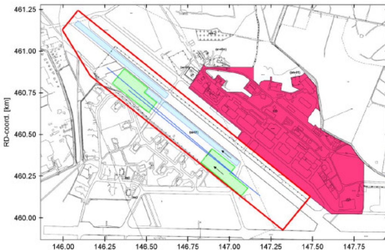
Figuur 1: Plantekening luchthaven Soesterberg in RD-coördinaten